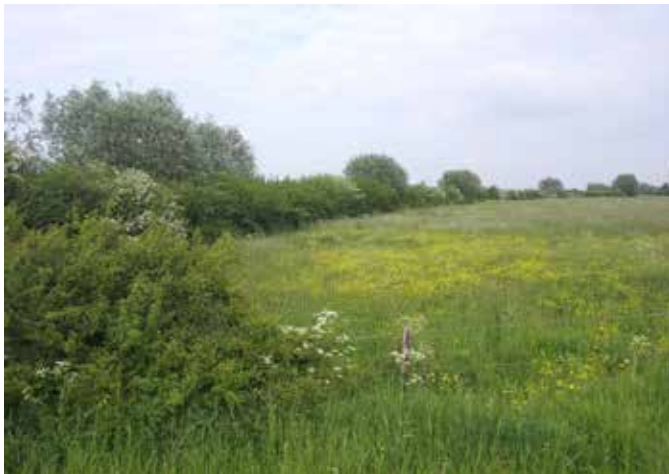
Vrij uitgroeiende struweelhaag langs een kruidenrijk grasland

Een struweelhaag is een lijnvormig landschapselement met een aaneengesloten opgaande begroeiing van inheemse, overwegend doornachtige, struiken, die vrij uit mogen groeien. Zo ontstaat een weelderige haag in tegenstelling tot een geknipte haag. Een struweelhaag bestaat vaak uit soorten als meidoorn, sleedoorn, hondsroos. Struweelhagen vormen een belangrijk leefgebied voor soorten als kamsalamander, grote lijster, steenuil, zomertortel, kneu en geelgors. De hagen bieden nest- en schuilgelegenheid en de bessen zorgen voor voedsel voor veel vogels.