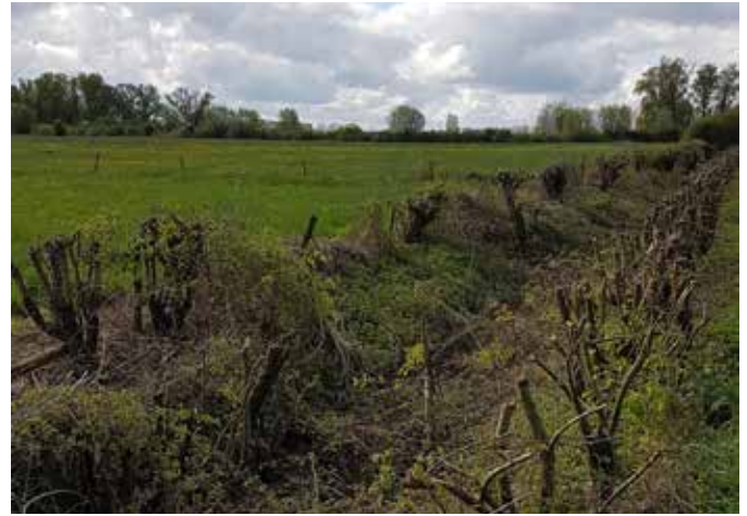
Struweelhaag is afgezet in de winterperiode

Als u er voor kiest de haag af te zetten, dan kan dat tussen de 6 à 15 jaar plaatsvinden. Struweelhagen langer dan 100 meter kunnen het beste in minimaal twee fasen afgezet worden. Ca. 50% van het element kan dan in het ene jaar afgezet worden, en ca. 50% minimaal 2 jaar later. Daarmee blijft altijd geschikt leefgebied beschikbaar voor vogels, kleine zoogdieren, amfibieën en insecten.